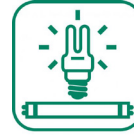
Ampoules et néons