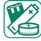
Piles et batteries