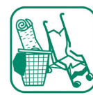
Encombrants (bâche, tuyaux...)