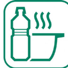
Huiles (moteur, friture...)