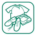
Vêtements (chaussures, pull...)