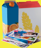
Papiers et emballages carton