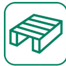
Bois (cigarettes, palettes...)