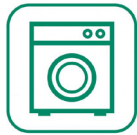
Électroménager (cafetière, congélateur...)