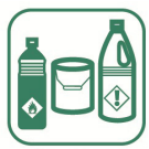
Déchets toxiques (peinture, solvants...)