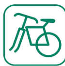
Ferraille (grillage, poêle...)