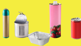
Emballages en métal, aluminium et acier : canettes, boîtes de conserves, aérosols...