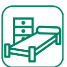
Mobilier (matelas, armoires, table...)