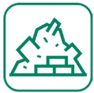
Gravats (briques, terre...)