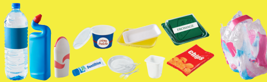
Tous les emballages en plastique : bouteilles, flacons, sacs, sachets, films, barquettes alimentaires, pots, boîtes...